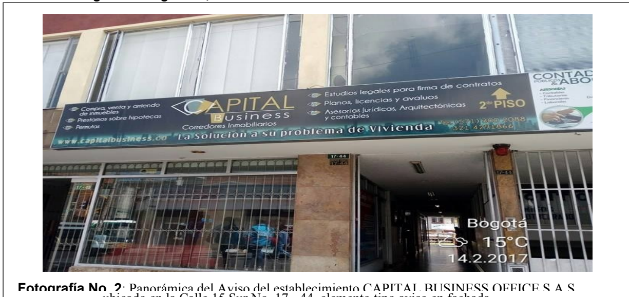
Fotografía No. 2: Panorámica del Aviso del establecimiento CAPITAL BUSINESS OFFICE S A S ubicado en la Calle 15 Sur No. 17-44 elemento tipo aviso en fachada.